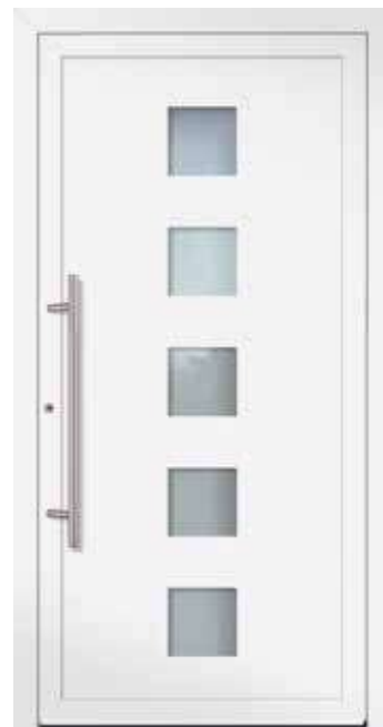
U d -Wert 1,23 1)

Farbe RAL 9007 Graualuminium FS Verglasung Satinato weiß LA 200 x 1.600 mm Mindestmaß = 800 x 1.990 mm