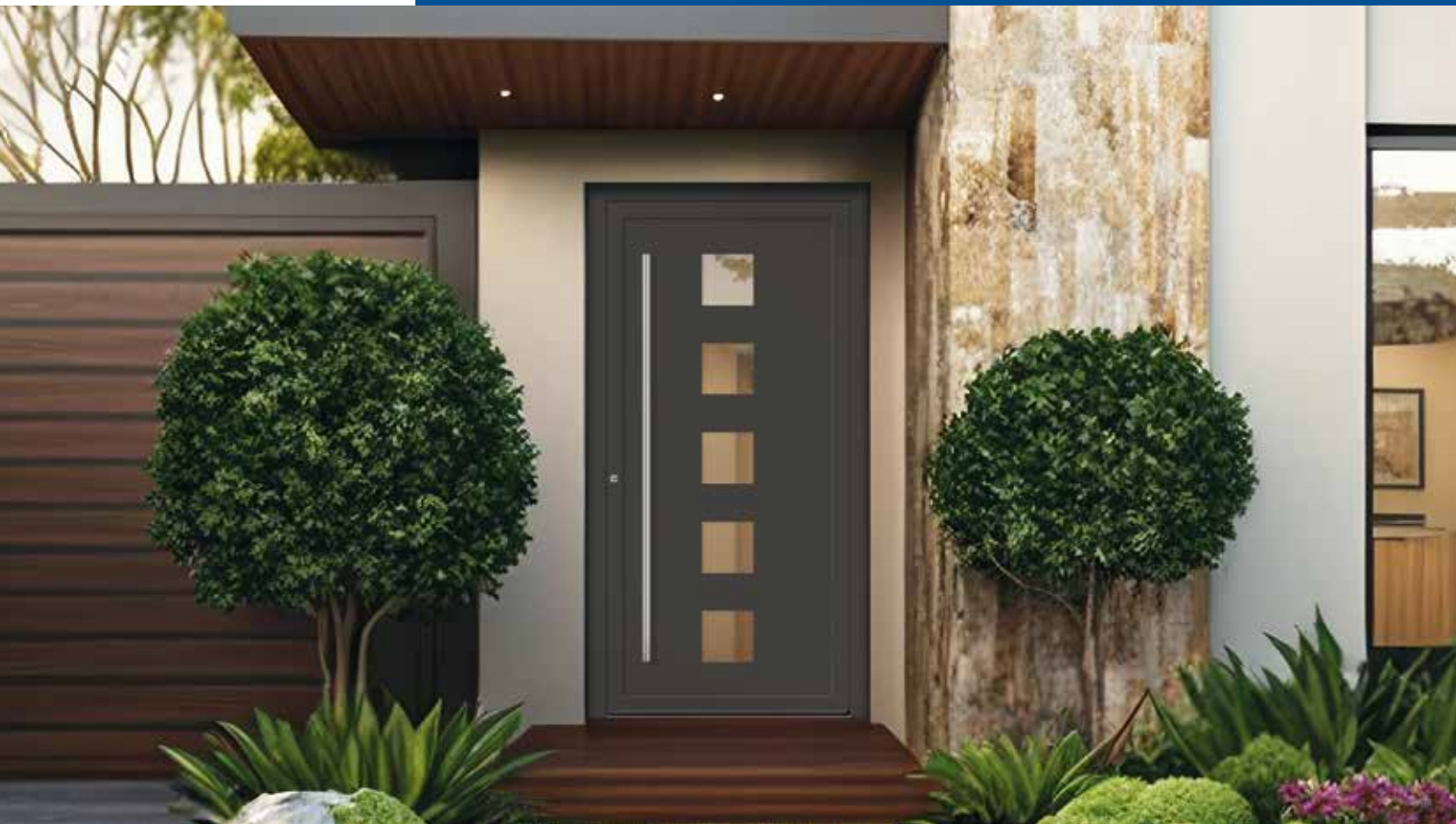
E 10 Farbe DB 703 Eisenglimmer FS / Verglasung Satinato weiß / Griff 3) S 1.600-1