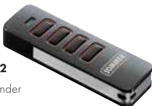
699252 Handsender Pearl