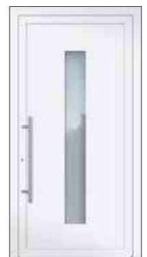
Höhe: 2.240 mm