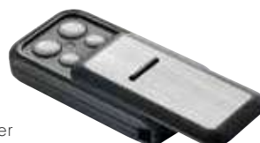
699626 Handsender Slider