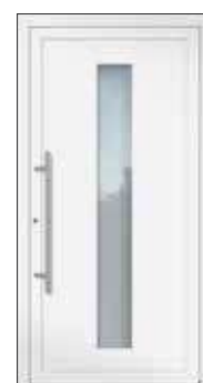
Höhe: 2.000 mm

Die Motivgrößen (Glasfelder) bleiben in der Höhe immer gleich und werden nicht individuell angepasst. Entsprechend wird bei abweichendem Höhenmaß der obere oder untere verbleibende Füllungsrand kleiner bzw. größer.