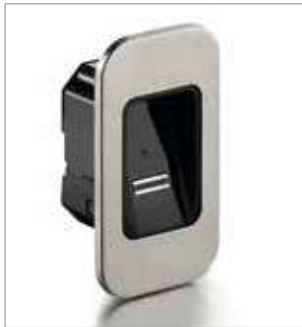
22052 ENTRAsys+ FD