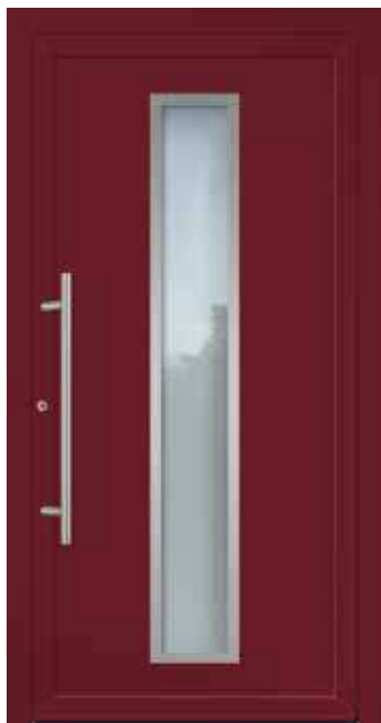
U d -Wert 1,23 1)