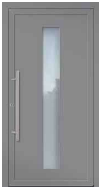
U d -Wert 1,23 1)

Farbe RAL 3005 Weinrot FS Verglasung Satinato weiß LA 200 x 1.600 mm Details Rahmen in Edelstahloptik außen Mindestmaß = 800 x 1.990 mm